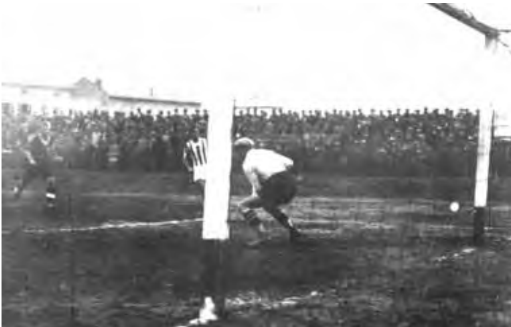
Anche la Juventus patisce il furore agonistico nerostellato. In alto il popolare allenatore nerostellato Giancarlo Castelli