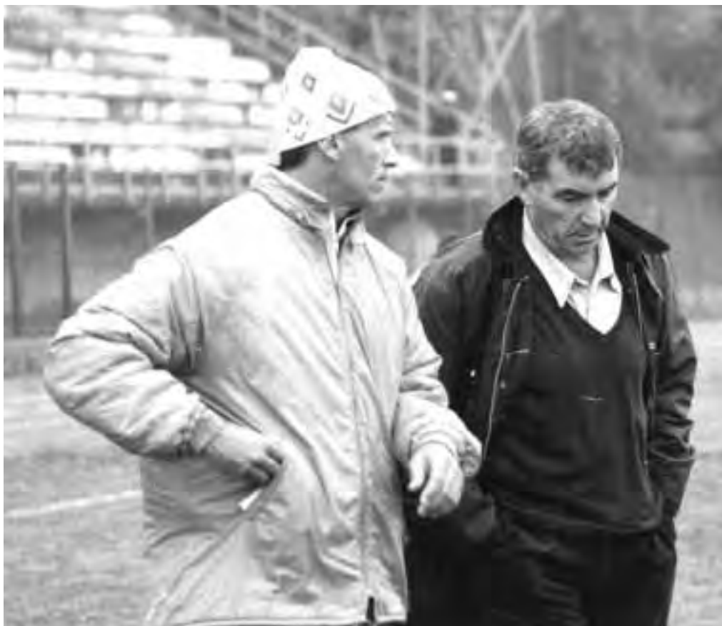
Lesca e Vincenzi cercano la 'quadra': tempi duri per il Casale relegato nel campionato di Eccellenza regionale.