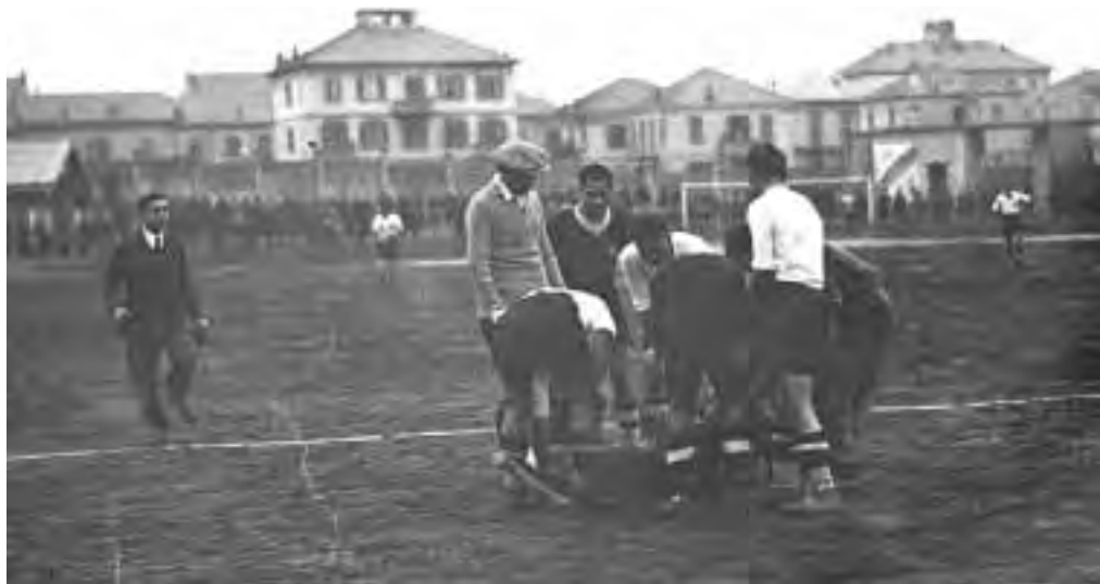
Il derby più sentito: quello con la Pro (Vercelli)