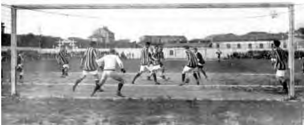
In alto il debutto tra i grandi nella massima categoria: 8 ottobre 1911 CASALE-INTER 0-3. Sotto una formazione nerostellata della stagione 1911-12, capitanata da Barbesino.