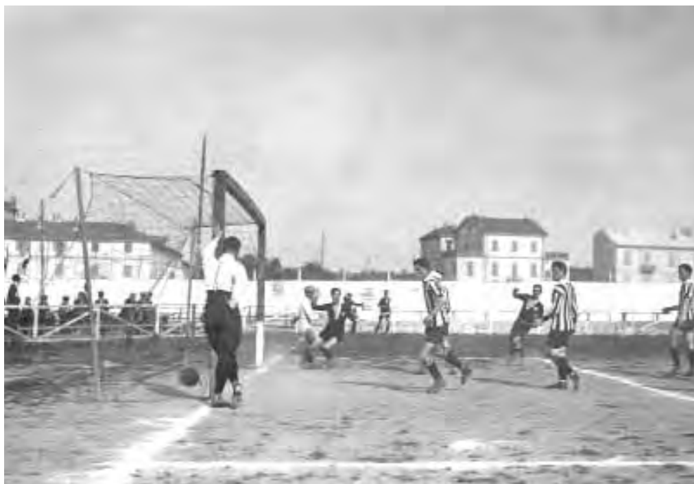
28 marzo 1915 CASALE-JUVENTUS 1-2: il gol nerostellato messo a segno da Mattea.