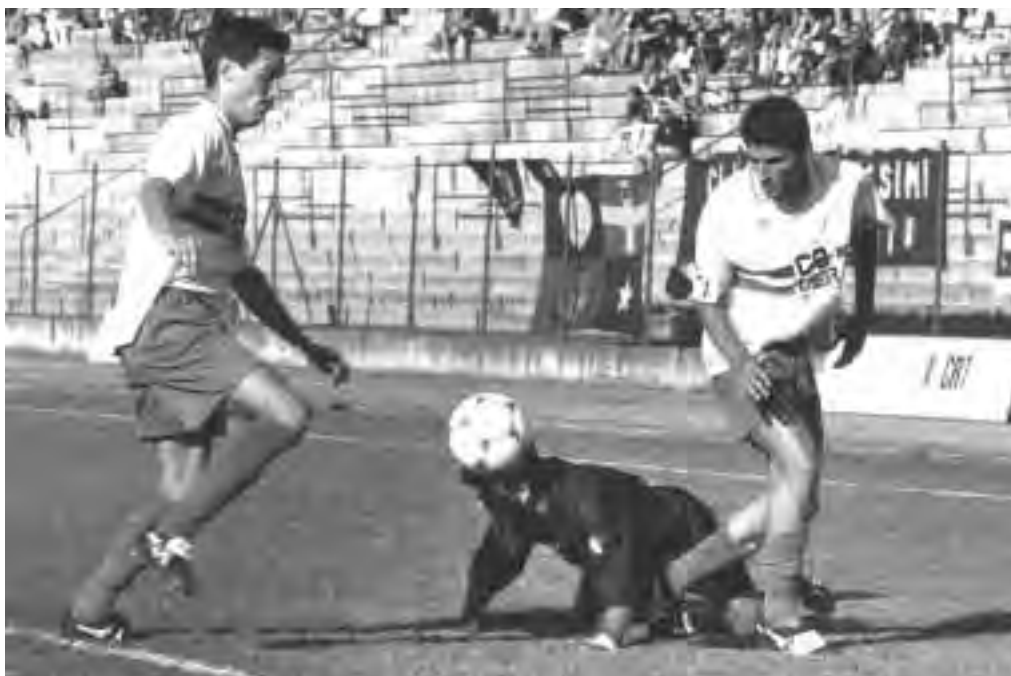
Izzo: un terzino con il pallone in testa