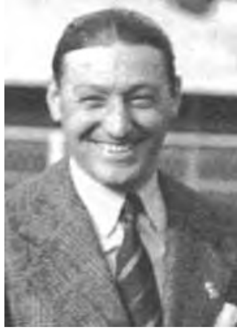
Un Caligaris nerostellato e un Caligaris borghese

mente convocarlo per i Campionati Mondiali di Roma, nei quali fece da portabandiera della squadra azzurra, partecipando in questa maniera al trionfo nella Coppa Rimet, nella quale si distinse un altro grande terzino casalese: Eraldo Monzeglio.