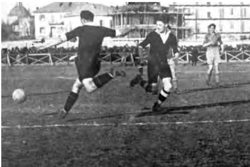
Il grande Caliga in azione sul campo di casa