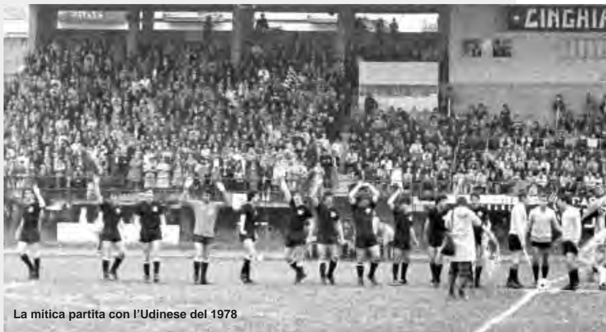
La mitica partita con l'Udinese del 1978

Correvano gli anni di fine Sessanta e la partecipazione dei tifosi e degli sportivi ca- salesi per il club nerostellato era intensa; una sottoscrizione raccolse quasi cinquan-