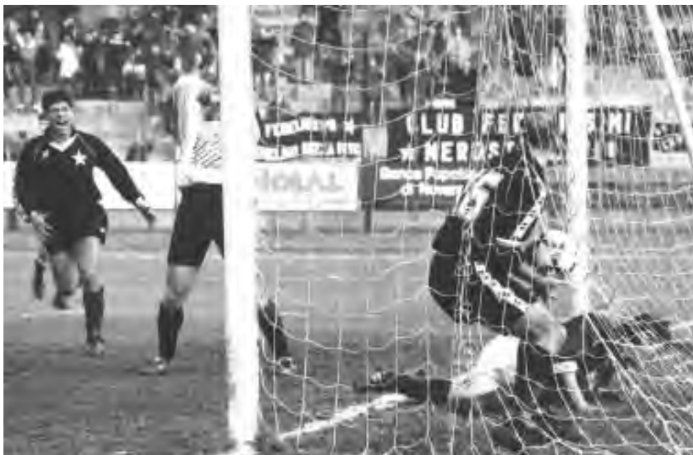
Gregoric: i gol si fanno anche così.