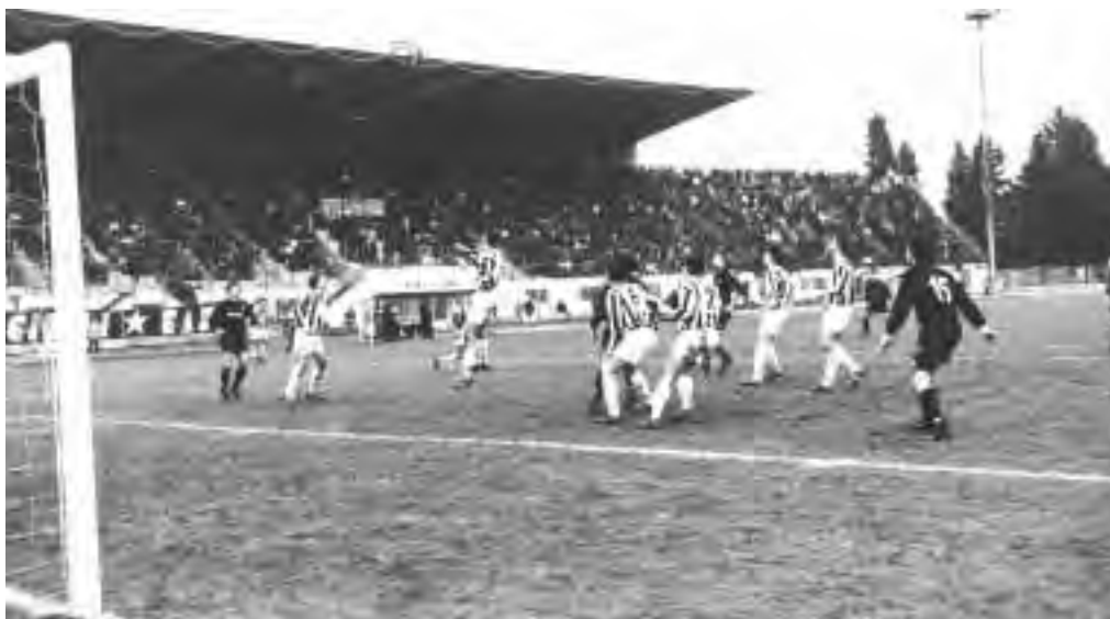
26 gennaio 1997 BIELLESE-CASALE 2-1: si spengono i sogni di promozione nerostellata. Sotto: 1996-97 la determinazione di Gianni Pilato.