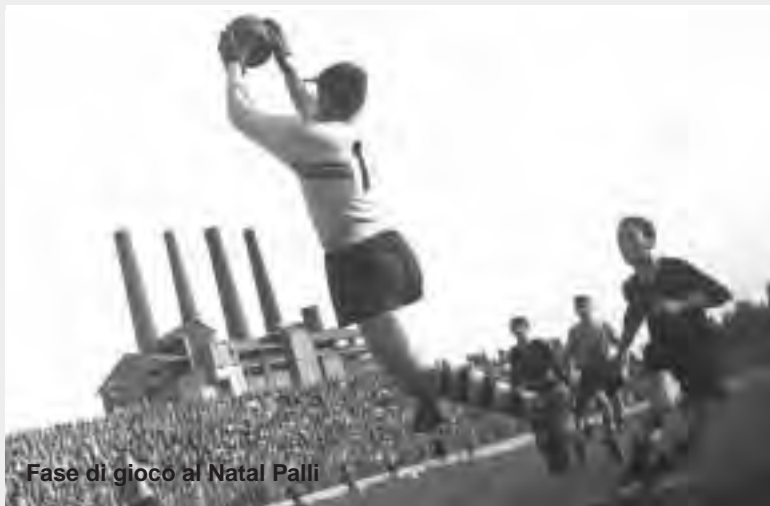
Fase di gioco ai Natal Palli