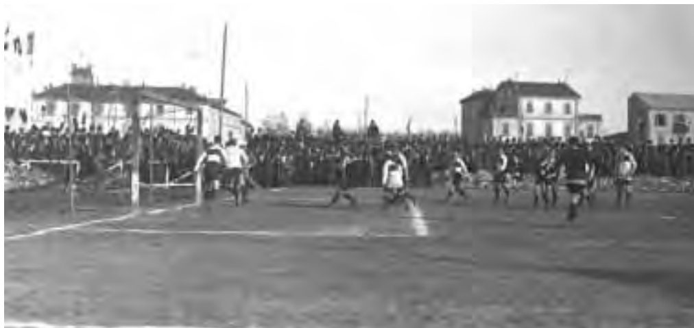
In alto una fase di gioco di CASALE-GENOA 0-1 del 29 ottobre 1911. Sotto una formazione del Casale del 1913.