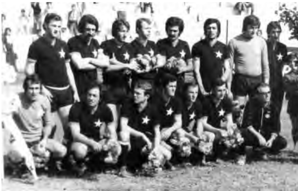
1973-74 Lo Juniorcasale promosso in serie C