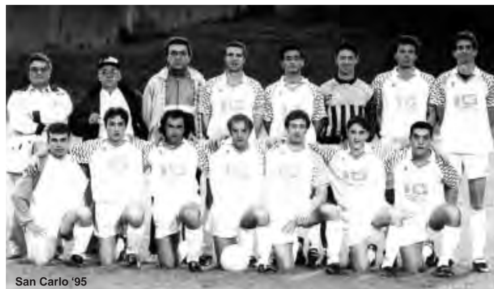
San Carlo '95