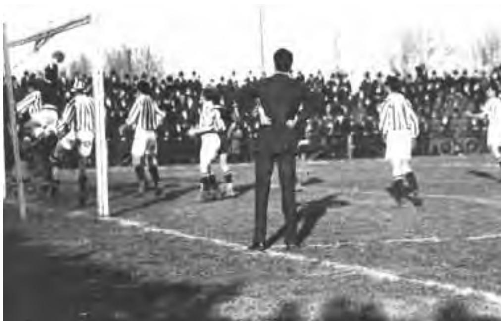
1913: il Casale batte il Reading 2-1