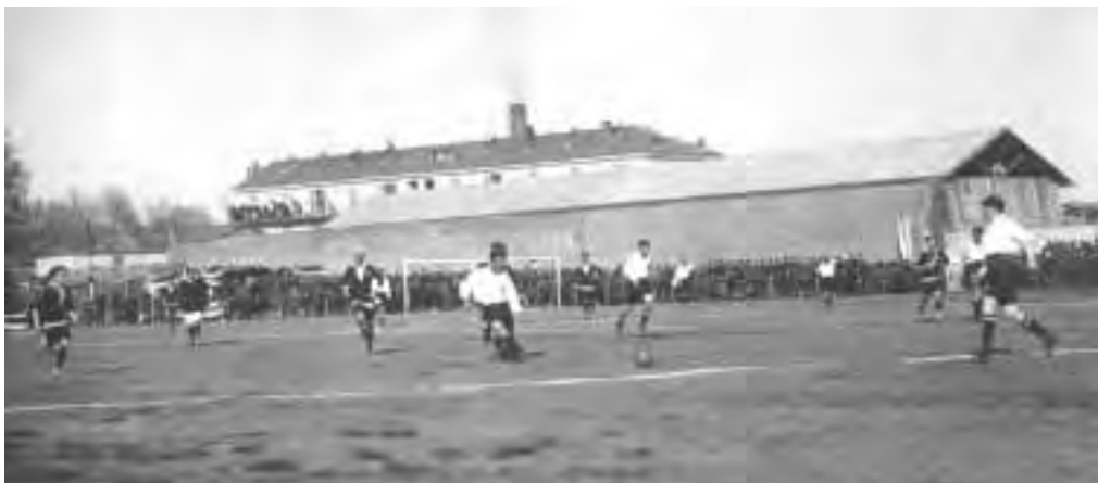
In alto CASALE-PRO VERCELLI 1-2 del 24 marzo 1912. Sotto la finale scudetto del 1914 CASALE-LAZIO 7-1: nell'immagine Gallina II mette a segno la rete del 5-0.