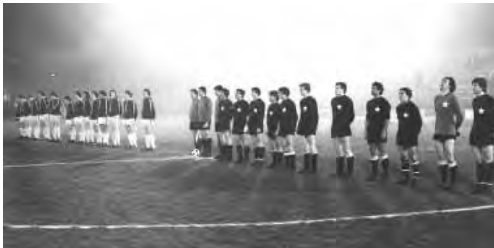
14 marzo 1979 JUNIORCASALE-SUTTON UNITED 1-1: le squadre pochi istanti prima del via